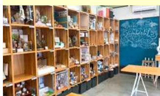
レンタルボックス

先日伺った際には、色艶と形の美しい新鮮なお野菜が販売されていました。こちらのお野菜、なんとオーナー様の畑で朝収穫され、その日に店頭で並ぶ「朝採れ野菜」なのだそう！収穫のタイミングが合えばオーナー様の畑で採れた新鮮なお野菜に出会えるかもしれません。