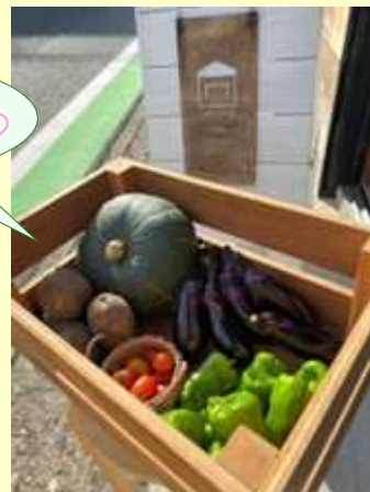
店頭で並んだ野菜

今年の8月はオープン記念の「マルシェ月間」ということで、普段箱に入っている作品が箱の外へ飛び出してディスプレイされ、販売されていました！他にもどら焼きやベーグルなどをはじめとする地元の美味しい物の販売や、ワークショップ、癒しの企画など…イベントも盛り沢山で大変にぎわっていらっしゃいました。私は季節の上生菓子づくりのワークショップに参加させて頂きました！ワークショップの詳細はまた次回のかわらばんにて紹介させて頂ければと思います。