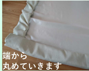
端から丸めていきます