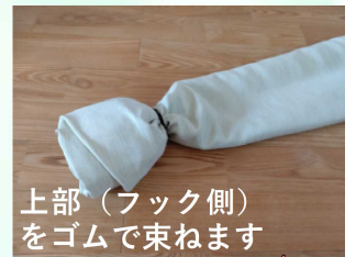
上部（フック側）をゴムで束ねます