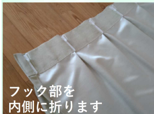
フック部を内側に折ります

樹脂製のフックの場合、取り外さずに洗濯することができます。フックが生地につかかって傷むのを防ぐため、以下のような手順で カーテンてるてる坊主 を作ります。