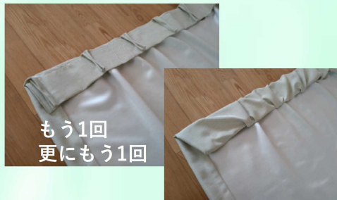
もう1回 更にもう1回